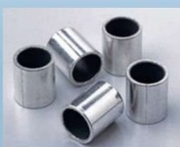
すべり軸受け(円筒)