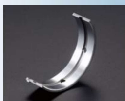
すべり軸受け(半割)