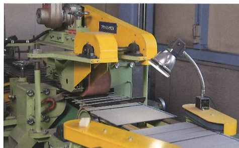
被覆アーク溶接棒の塗装