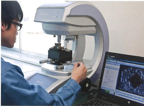
マイクロビッカースでの硬度測定

WELDING CONSUMABLES DESIGN AND DEVELOPMENT DEPT.