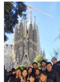
2018年 バルセロナ旅行

< 福利厚生 > 健康保険、厚生年金基金、企業年金基金、雇用保険、労災保険 親睦会積立補助(2年に一度海外社員旅行)・同好会(ゴルフ) 従業員持株会(会社補助あり)・永年勤続表彰 健康管理(定期健康診断、人間ドック) 借り上げ社宅、借家補助支給あり 社外研修奨励補助・社内教育制度(研修、セミナー)