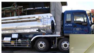
ローリー車等で 工業薬品は配送