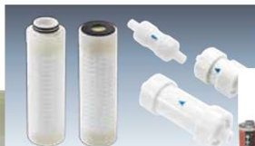
中空糸フィルター