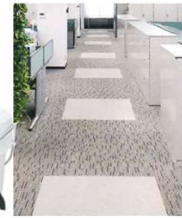
タイルカーペット