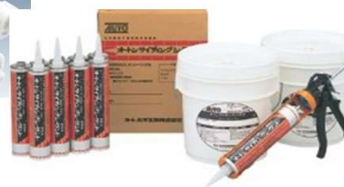
一液ウレタンシーリング材