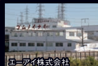
エーアイ株式会社