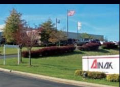
AINAK(米国ケンタッキー州)

AINAK(米国ケンタッキー州)・NESINAK(インドネシア)・THAINAK(タイ)・PHILINAK(フィリピン)・ HOINAK(稲木国際(香港))・稲木貿易(上海)・稲木科技(チェンゾウ)・稲木精密(シンセン)・EURONAK(チェコ)・ VIETINAK(ベトナム)・TENJINAK(インド)・MYARNAK(ミャンマー)・W&W(シンガポール)など18拠点