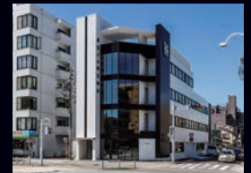
建設ゴム株式会社