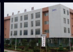
稲木科技(中国:チェンゾウ)