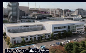
ゴムノイナキ工業株式会社