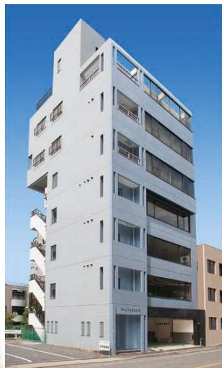
本社 Head Office

SUGIMURA continues to move forward by relentless pursuit of high technical development and strict quality control.