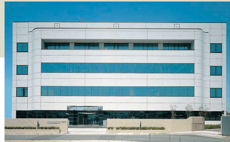
研究所 Technical Center